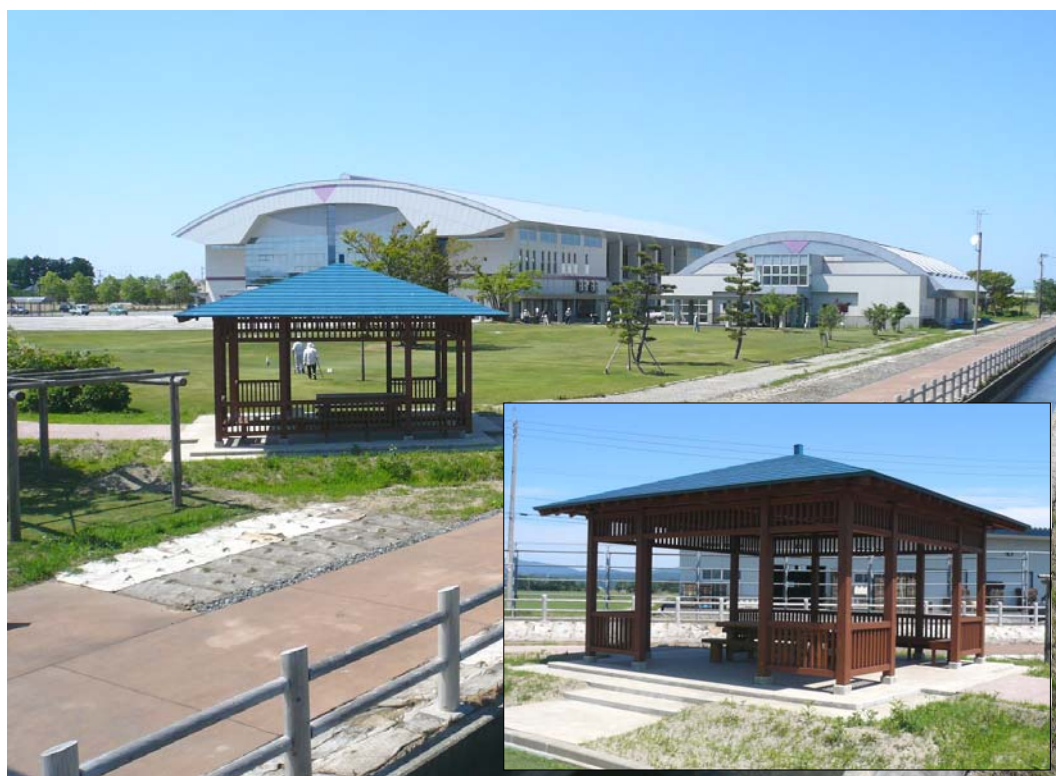
因幡堰地区地域用水機能増進事業「東2号幹線水路休憩施設」平成19年12月完成